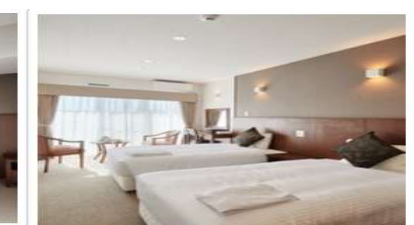
【ホテルタイプ】ツインルーム

更にお土産・観光体験共通クーポン+観光体験クーポン各2000円分・合計4,000円分を人数分差し上げます!!