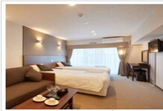
【コンドミニアムタイプ】ツインルーム (3名対応)

1室3名様利用15000円(税込)×3名・15000円(税込)をなんとクーポン利用(3名13500円割引)お客様負担1500円のみ!!