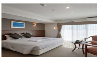
【ホテルタイプ】ダブル ルーム