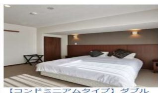
【コンドミニアムタイプ】ダブル ルーム