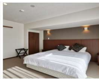
【コンドミニアムタイプ】ダブル ルーム