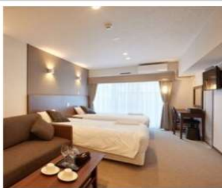
【コンドミニアムタイプ】ツイン ルーム (3名対応)

選べる部屋タイプ「ホテルタイプダブル・コンドミニアムダブル・ホテルタイプツイン・コンドミニアムツイン」(1名～3名様)1室 1室1名様利用5000円(税込)がなんとクーポン利用(4500円割引)お客様負担500円のみ!! 1室2名様利用10000円(税込)×2名・10000円(税込)なんとクーポン利用(2名で9000円割引)お客様負担1000円のみ!! 1室3名様利用15000円(税込)×3名・15000円(税込)なんとクーポン利用(3名13500円割引)お客様負担1500円のみ!!