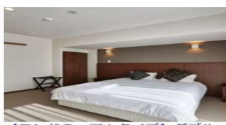
【コンドミニアムタイプ】ダブルルーム