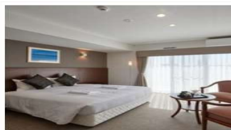
【ホテルタイプ】ダブルルーム