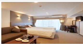
【コンドミニアムタイプ】ツインルーム (3名対応)