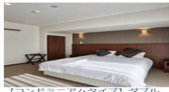
【コンドミニアムタイプ】ダブルルーム