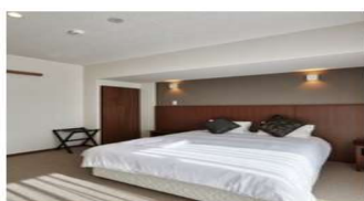
【コンドミニアムタイプ】ダブルルーム